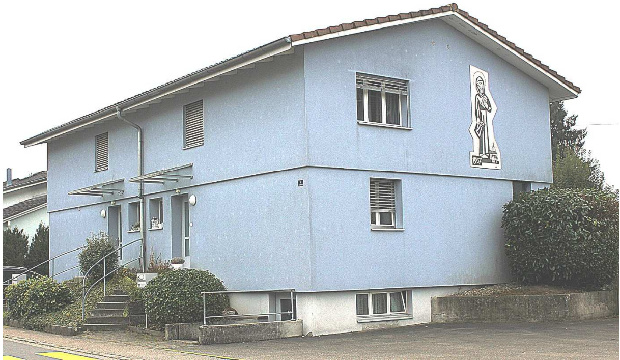
Verenahaus, Baujahr 1957, Arigstrasse 4, 6018 Buttisholz