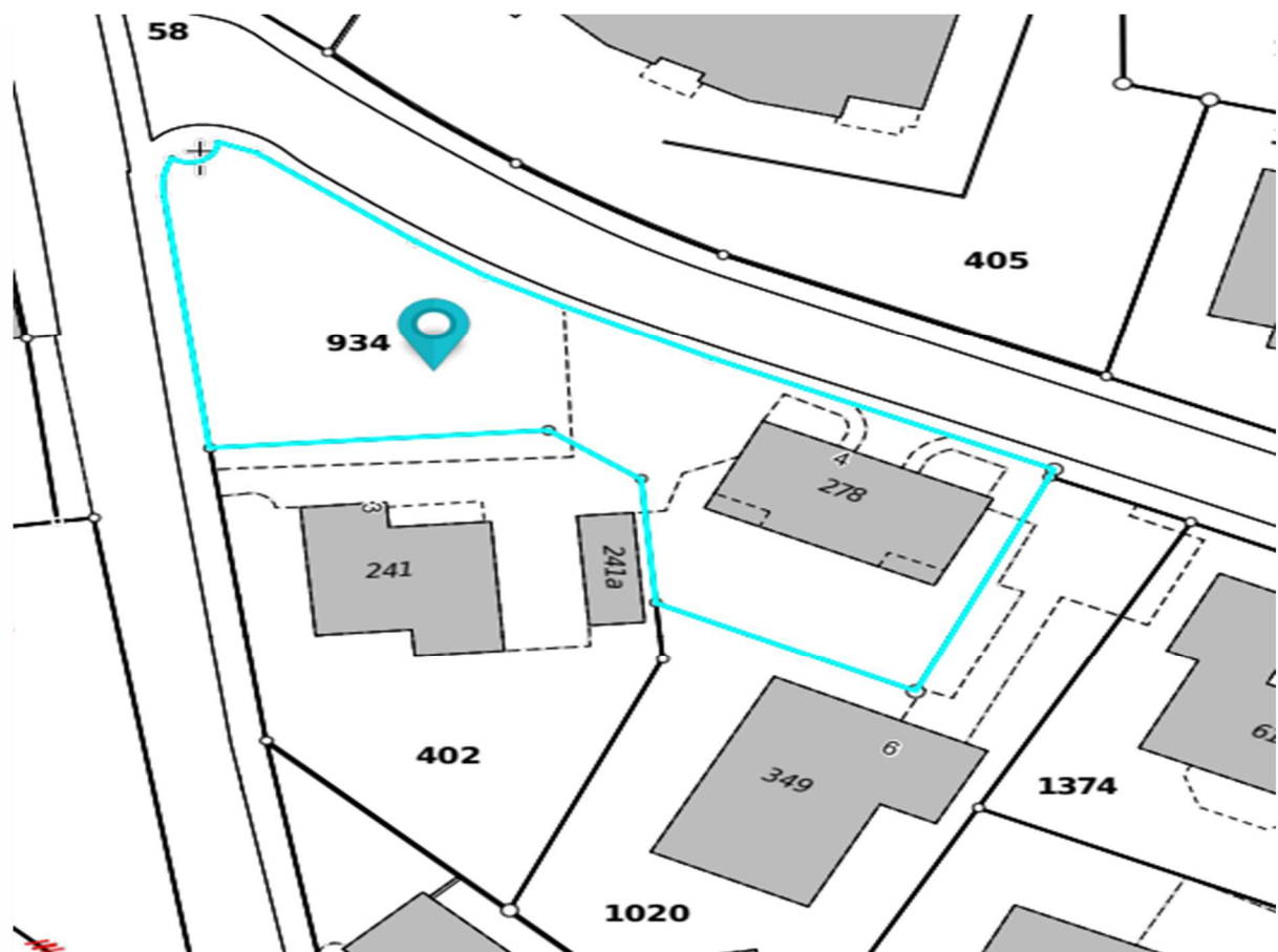
Ausschnitt Grundbuchplan Buttisholz. Parzelle 934